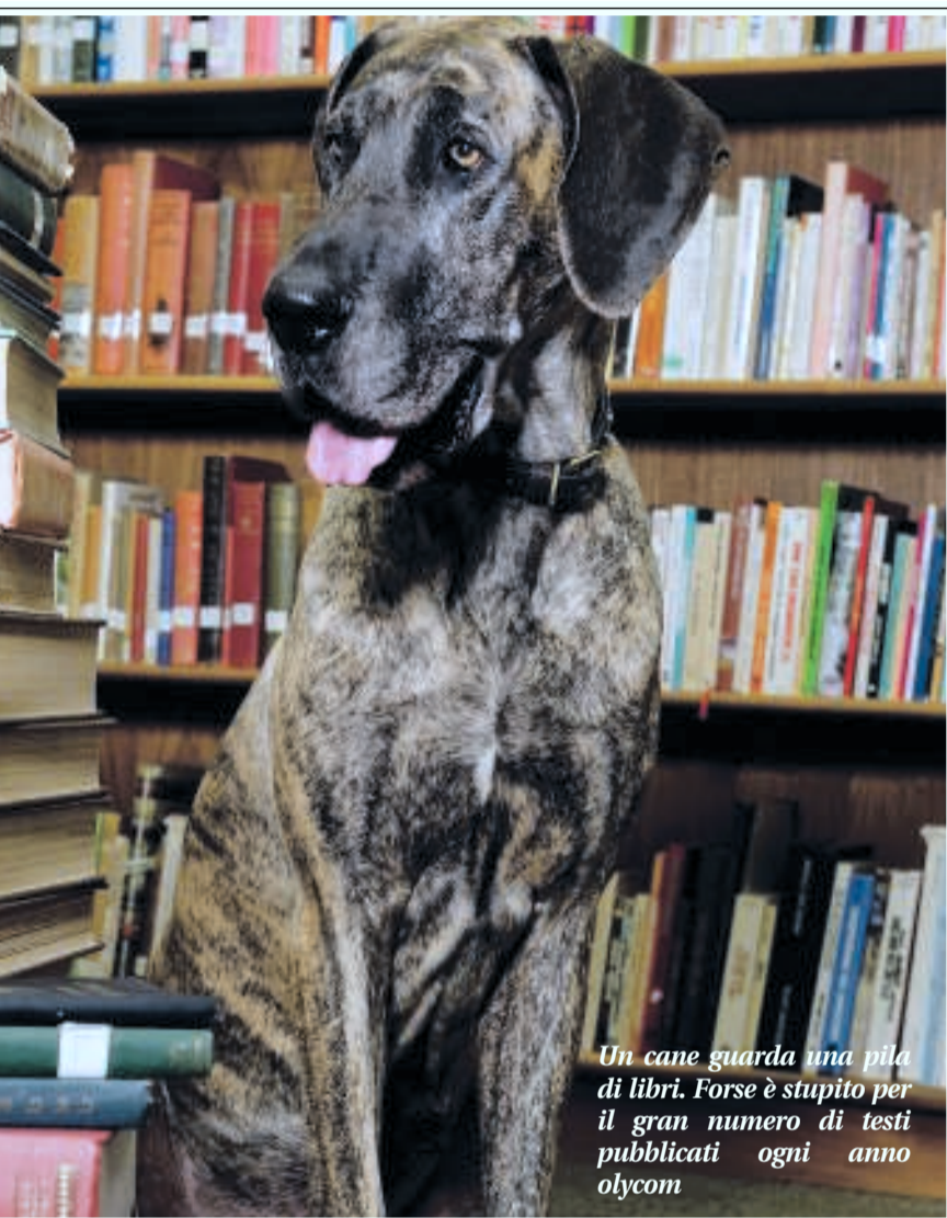
Un cane guarda una pila di libri. Forse è stupito per il gran numero di testi pubblicati ogni anno

E a Torino, da sempre in competizione con la cugina Milano, sono in molti a pensare che il ritorno a casa dello «Struzzo», con un profilo editoriale e un catalogo più identitario, sarebbe un forte segnale di riscatto del territorio sa- baudo.